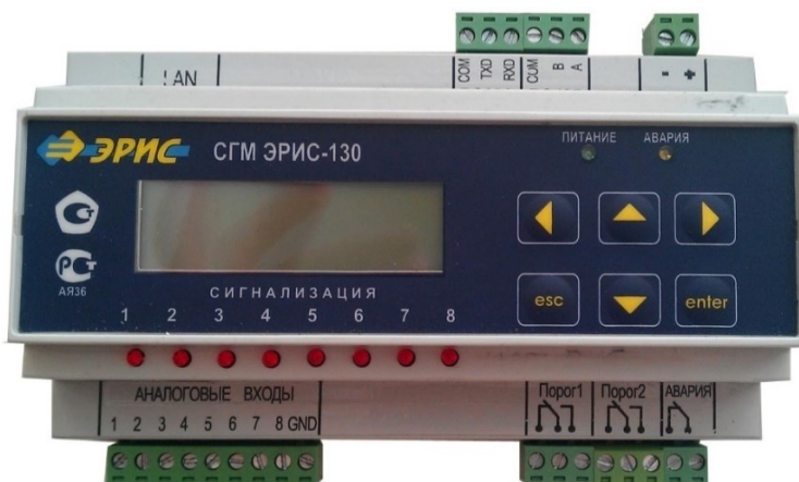
СГМ ЭРИС-130 (токовый, DIN-рейка) до 2015 года выпуска