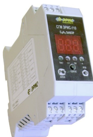
СГМ ЭРИС-110 В/Д, А/Д (потенциальный/токовый, DIN-рейка)