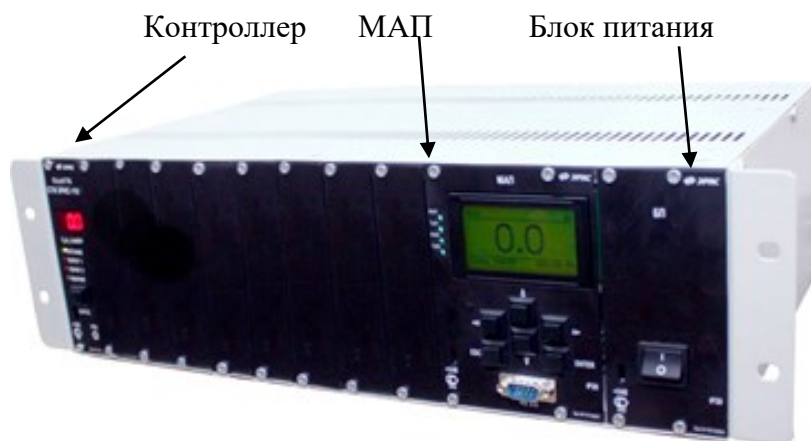
СГМ ЭРИС-110 В/К, А/К с МАП (потенциальный/токовый, 19" слот)