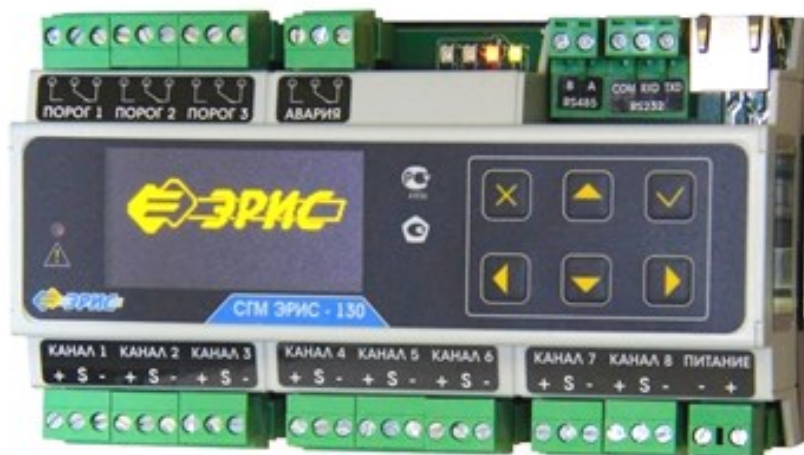
СГМ ЭРИС-130 (токовый, DIN-рейка)