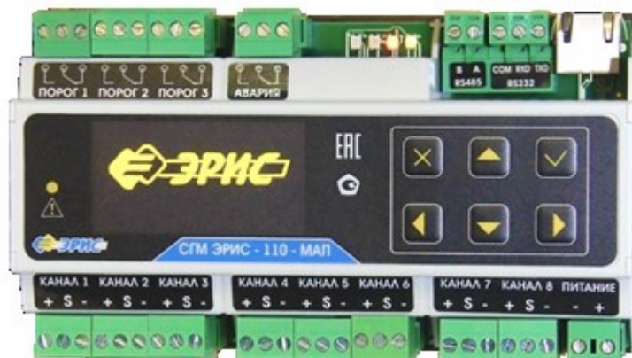
Рисунок 4 - Общий вид МАП СГМ ЭРИС-110 (DIN-рейка)